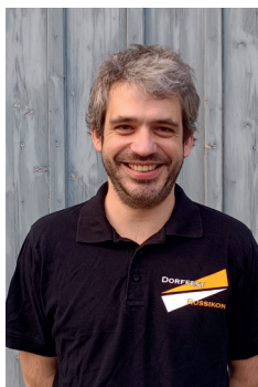
Ramon Stamm Marketing, Presse